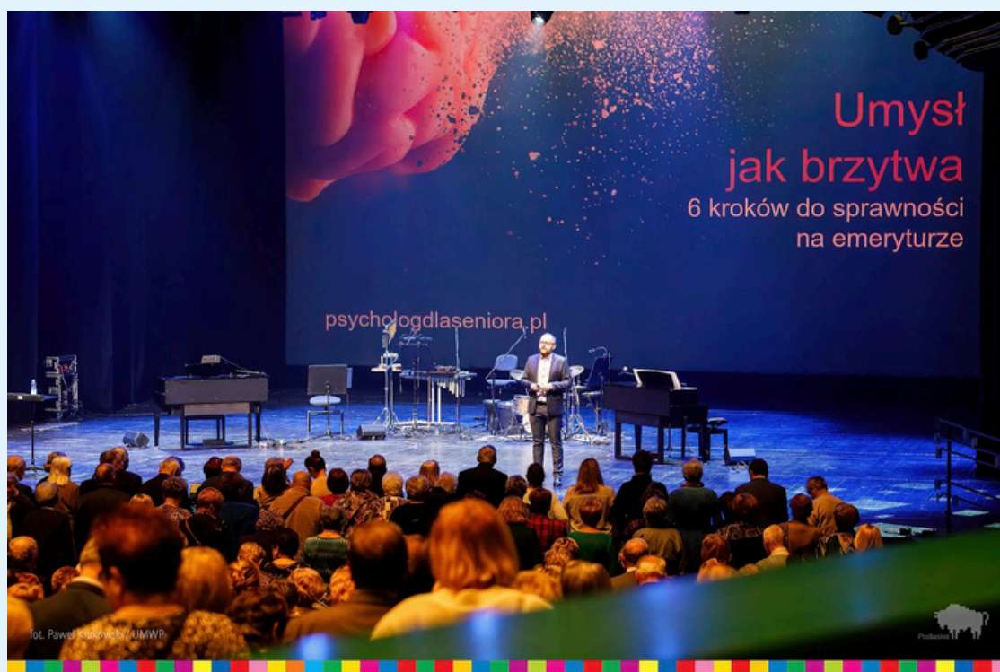
Wykład w Operze i Filharmonii Podlaskiej w ramach Podlaskiego Forum Seniorów, fot. P. Krukowski UMWP, 2024