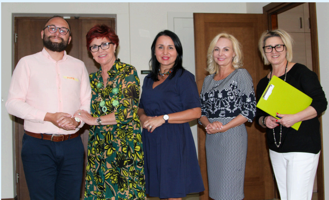
Projekt Wodzirej realizowany przez Fundację J. Kwaśniewskiej ze środków Dzielnicy Warszawa-Śródmieście, fot. A. Stefaniak, 2023